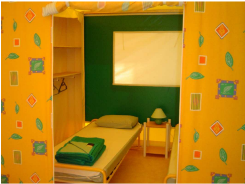
Una habitación con dos camas individuales

El espíritu de la acampada con todo el confort - alojamiento de tela en espacios sombríos. Superficie de 25 m 2 + 7 m 2 de terraza cubierta, 2 habitaciones, cuarto de baño, cocina totalmente equipada. En la esquina de la cocina encontrará una nevera, una placa de gas de cuatro fuegos y un fregadero de dos pilas. Hay vajilla y utensilios de cocina en número suficiente para una capacidad máxima de cinco personas. Estos bungalows se sitúan en la zona de camping.