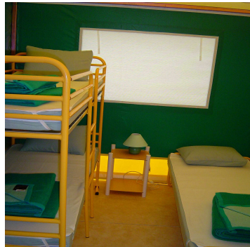
Una habitación con tres camas pequeñas (2 de ellas en litera con barrera)